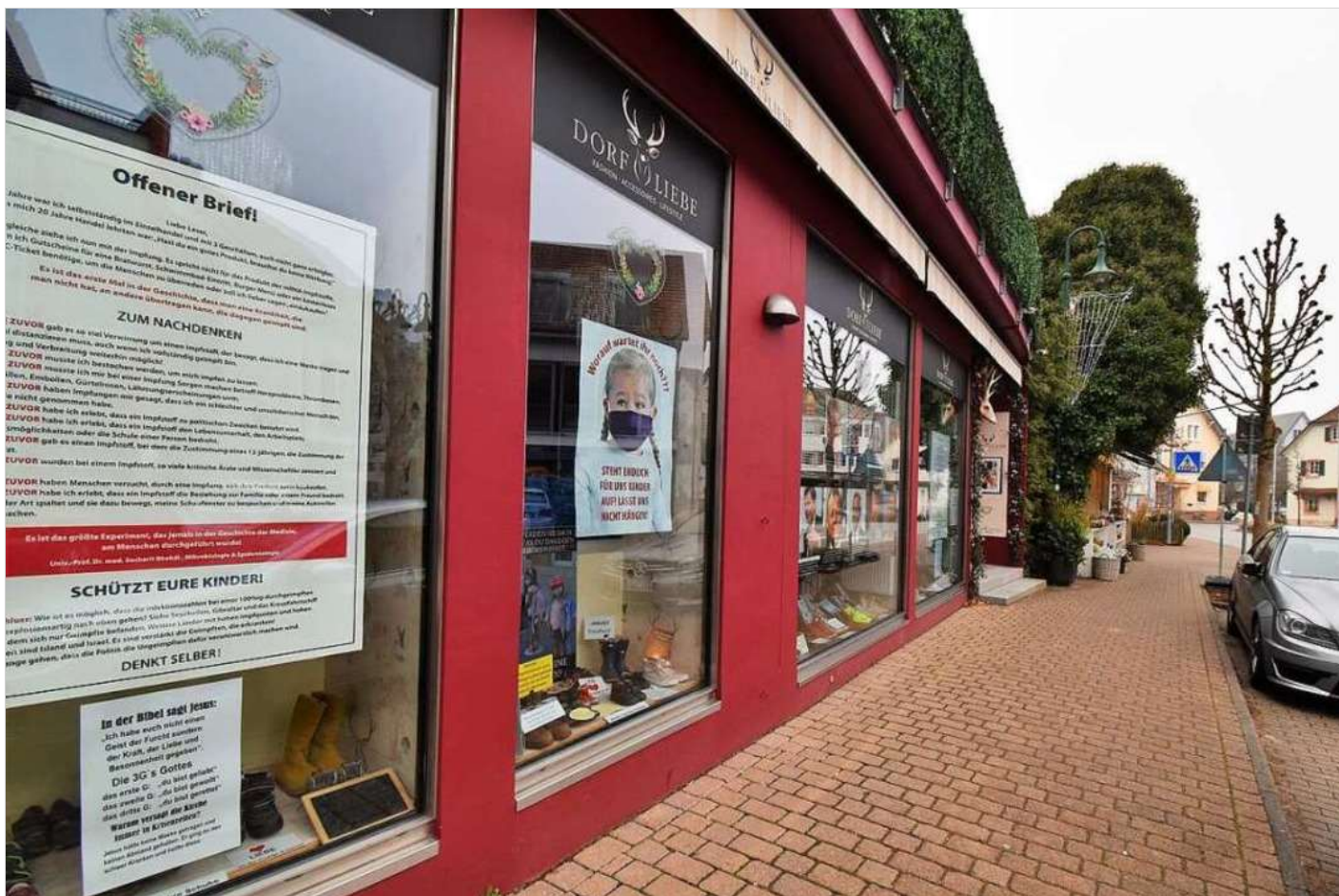
Statt Waren zeigt dieses Kirchzartener Schaufenster Kritik an den Corona-Maßnahmen.

BZ-Plus | Immer mehr Kirchzartener Bürger beschwerten sich über die Demonstrationen sogenannter Querdenker. Mit dem Thema hat sich nun auch der Gemeinderat auseinandergesetzt.